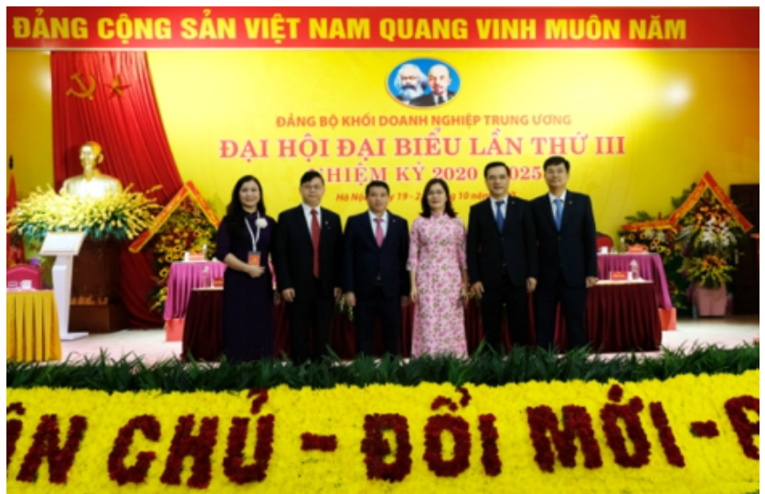
Đoàn Đại biểu SCIC tham dự Đại hội đại biểu Đảng bộ Khối Doanh nghiệp Trung ương lần thứ III, nhiệm kỳ 2020 – 2025 chụp ảnh cùng đồng chí Y Thanh Hà Niê Kđăm, Ủy viên dự khuyết Ban Chấp hành Trung ương Đảng, Bí thư Đảng ủy Khối Doanh nghiệp Trung ương

Trong phiên làm việc ngày 20/10, Đại hội đại biểu Đảng bộ Khối Doanh nghiệp Trung ương lần thứ III, nhiệm kỳ 2020 – 2025 đã nghe, thảo luận: báo cáo chính trị của Ban Chấp hành Đảng bộ nhiệm kỳ 2015 – 2020; báo cáo kiểm điểm của Ban Chấp hành Đảng bộ nhiệm kỳ 2015 – 2020; báo cáo tổng hợp ý kiến tham gia vào dự thảo các văn kiện của Trung ương trình Đại hội XIII của Đảng. Đại hội cũng đã tiến hành bầu 45 đồng chí vào Ban Chấp hành Đảng bộ Khối Doanh nghiệp Trung ương, lấy phiếu giới thiệu nhân sự Bí thư Đảng ủy Khối nhiệm kỳ 2020 – 2025; bầu Đoàn đại biểu của Đảng bộ Khối gồm 28 đại biểu chính thức và một số đại biểu dự khuyết tham dự Đại hội lần thứ XIII của Đảng. Buổi chiều ngày 20/10, Ban Chấp hành Đảng bộ Khối nhiệm kỳ 2020 – 2025 tiến hành Hội nghị lần thứ nhất, bầu Ban Thường vụ Đảng ủy Khối gồm 16 đồng chí; bầu đồng chí Bí thư, các đồng chí Phó Bí thư Đảng ủy Khối; bầu Ủy ban Kiểm tra gồm 11 đồng chí, bầu đồng chí Chủ nhiệm Ủy ban Kiểm tra Đảng ủy Khối nhiệm kỳ 2020-2025.