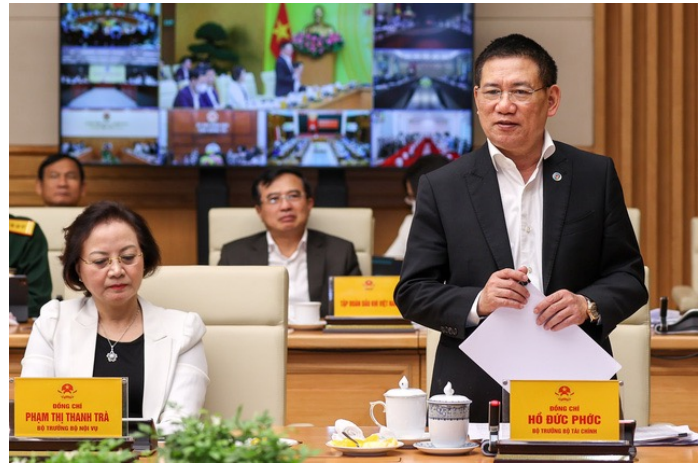
Bộ trưởng Bộ Tài chính Hồ Đức Phớc

Chính vì vậy, nhiệm vụ, giải pháp tiếp theo là tiếp tục cơ cấu lại DNNN, xây dựng kế hoạch 5 năm, hằng năm đối với các hình thức sắp xếp lại, chuyển đổi sở hữu trên cơ sở bám sát các quy định tại Quyết định số 22/2021/QĐ-TTg ngày 2/7/2021 của Thủ tướng Chính