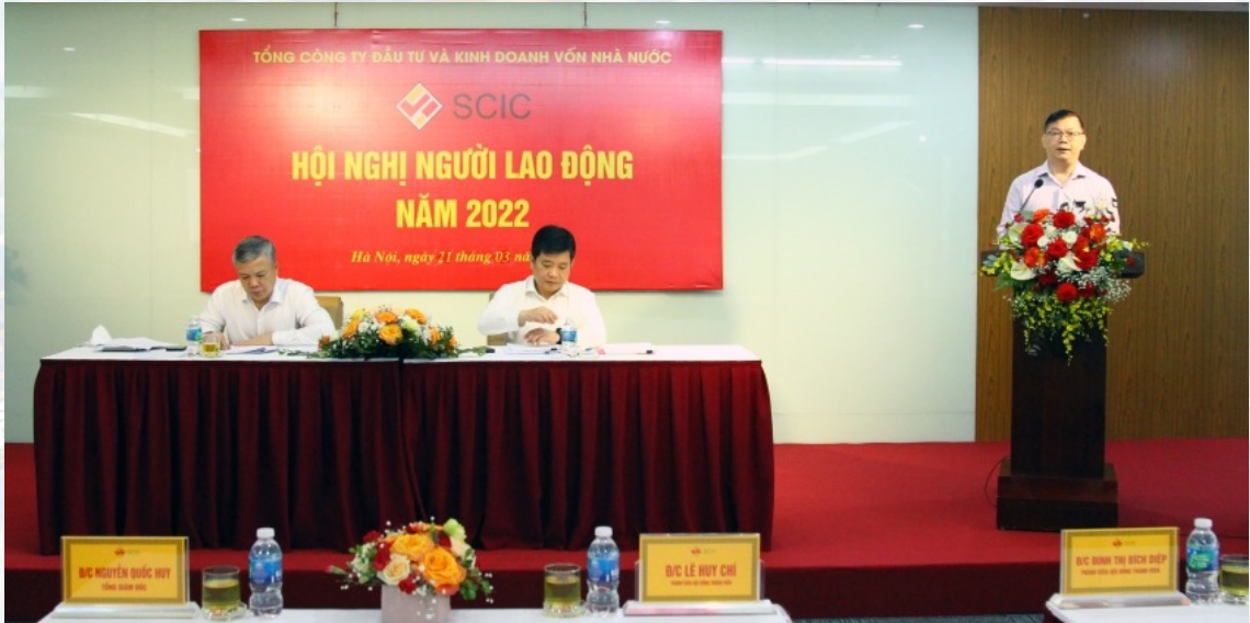
SCIC tổ chức Hội nghị Người lao động năm 2022

Ngày 20/3/2022 tại Hà Nội, SCIC đã tổ chức Hội nghị Người lao động năm 2022 theo hình thức trực tiếp và trực tuyến.