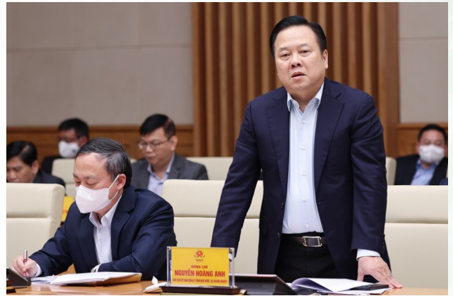
Chủ tịch Ủy ban Quản lý vốn nhà nước tại doanh nghiệp Nguyễn Hoàng Anh

Ông Hoàng Anh cho biết, giai đoạn 2016-2020 đối với công ty mẹ - 19 tập đoàn, tổng công ty có tổng doanh thu đạt 3.821.579 tỷ