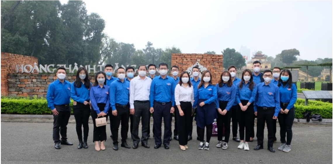
Hoạt động giáo dục truyền thống lịch sử của Đoàn TN SCIC tại Khu di tích Hoàng thành Thăng Long nhân dịp kỷ niệm 91 năm ngày thành lập Đoàn TNCSHCM

của Đoàn đã và đang hiệu triệu đông đảo đoàn viên, thanh niên (ĐVTN) trên cả nước tham gia. Hình ảnh đẹp của tuổi trẻ Việt Nam với màu áo xanh tươi trẻ cùng tinh thần “Đâu cần thanh niên có, việc gì khó có thanh niên”, “Gian khó chí không sờn” đã tạo nên dấu ấn đẹp với xã hội, cộng đồng, tô thắm truyền thống 91 năm vẻ vang của Đoàn TNCS Hồ Chí Minh.