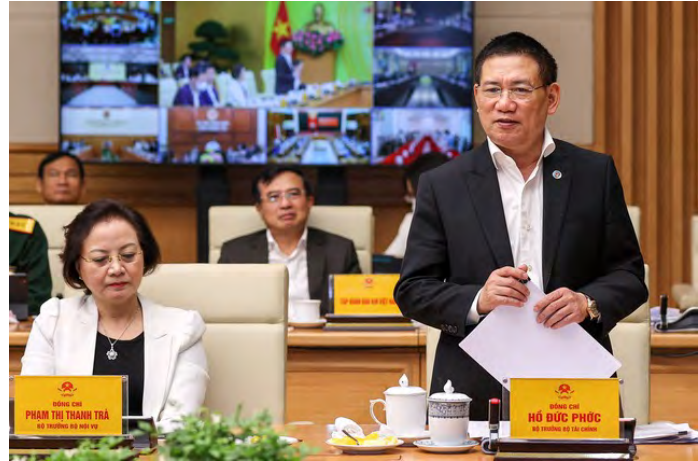
Bộ trưởng Bộ Tài chính Hồ Đức Phớc

Chính vì vậy, nhiệm vụ, giải pháp tiếp theo là tiếp tục cơ cấu lại DNNN, xây dựng kế hoạch 5 năm, hằng năm đối với các hình thức sắp xếp lại, chuyển đổi sở hữu trên cơ sở bám sát các quy định tại Quyết định số 22/2021/QĐ-TTg ngày 2/7/2021 của Thủ tướng Chính