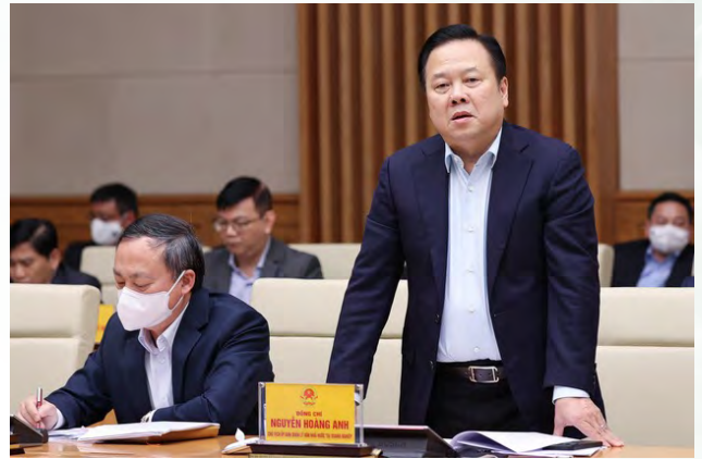
Chủ tịch Ủy ban Quản lý vốn nhà nước tại doanh nghiệp Nguyễn Hoàng Anh

Ông Hoàng Anh cho biết, giai đoạn 2016-2020 đối với công ty mẹ - 19 tập đoàn, tổng công ty có tổng doanh thu đạt 3.821.579 tỷ