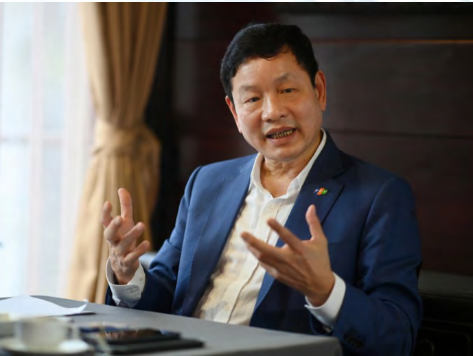
Ông Trương Gia Bình - Chủ tịch Hội đồng quản trị FPT.