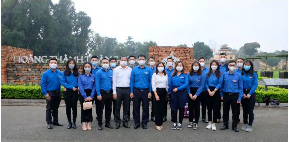
Hoạt động giáo dục truyền thống lịch sử của Đoàn TN SCIC tại Khu di tích Hoàng thành Thăng Long nhân dịp kỷ niệm 91 năm ngày thành lập Đoàn TNCSHCM

của Đoàn đã và đang hiệu triệu đông đảo đoàn viên, thanh niên (ĐVTN) trên cả nước tham gia. Hình ảnh đẹp của tuổi trẻ Việt Nam với màu áo xanh tươi trẻ cùng tinh thần “Đâu cần thanh niên có, việc gì khó có thanh niên”, “Gian khó chí không sờn” đã tạo nên dấu ấn đẹp với xã hội, cộng đồng, tô thắm truyền thống 91 năm vẻ vang của Đoàn TNCS Hồ Chí Minh.