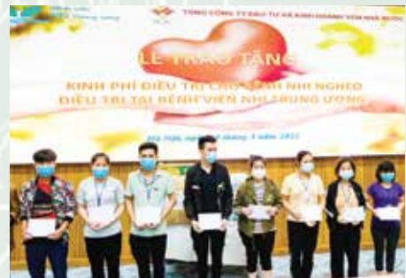
Ngày 18/3 tại Bệnh viện Nhi trung ương – Hà Nội, SCIC đã trao tặng cho 50 gia đình trẻ em có hoàn cảnh khó khăn đang điều trị tại bệnh viện