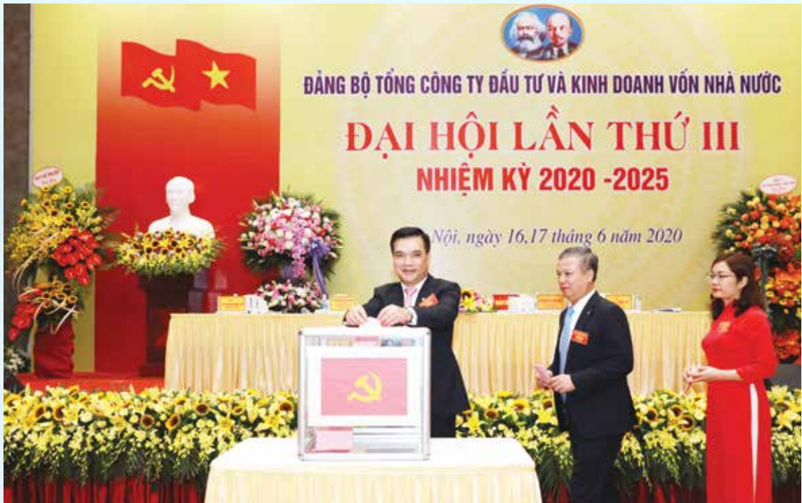
Đại hội Đảng bộ SCIC lần thứ III, nhiệm kỳ 2020 - 2025

các quỹ đầu tư này trong thời gian đầu sẽ tập trung trước hết và chủ yếu vào thị trường trong nước, trước khi từng bước mở rộng ra các thị trường quốc tế, trên cơ sở tích lũy các nguồn lực và kinh nghiệm đầu tư. Nhiều quốc gia thành lập quỹ đầu tư chính phủ để đầu tư vào những doanh nghiệp dẫn dắt nền kinh tế, doanh nghiệp đầu ngành trong những lĩnh vực quan trọng, hỗ trợ doanh nghiệp khi gặp khó khăn, thậm chí nhiều quỹ đầu tư chính phủ còn đầu tư vào các doanh nghiệp nước ngoài hoặc cho chính phủ nước ngoài vay vốn.