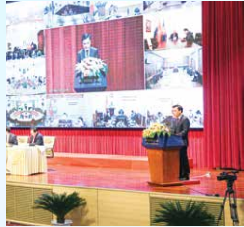
_SỰ KIỆN NỔI BẬT_