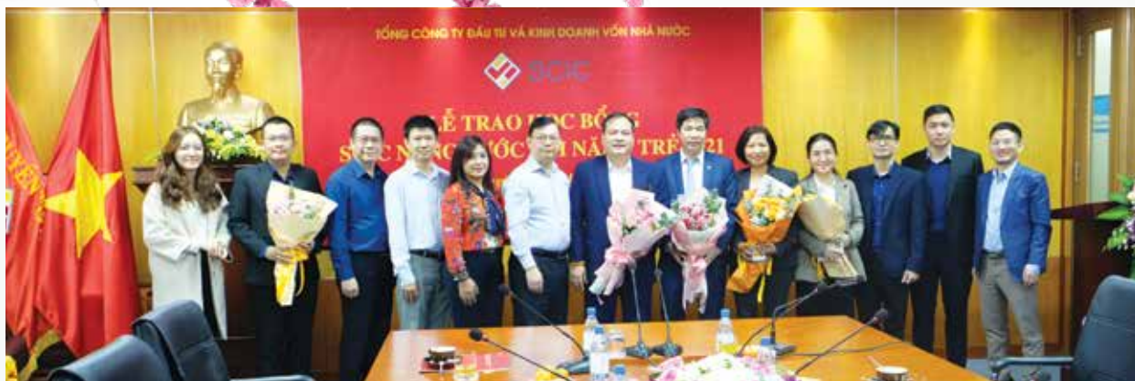
Thực hiện chương trình tài trợ giáo dục, ngày 3/12/2021, tại Hà Nội, SCIC đã tổ chức trao Học bổng SCIC nâng bước tài năng trẻ 2021 cho 45 sinh viên xuất sắc thuộc các trường đại học khối ngành kinh tế, tài chính, luật trên toàn quốc.