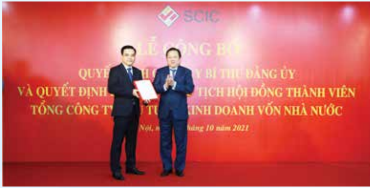
_SỰ KIỆN NỔI BẬT_

Sáng ngày 27/10/2021, được sự đồng ý của Lãnh đạo Chính phủ và Đảng ủy Khối Doanh nghiệp trung ương (DNTW), tại trụ sở SCIC đã diễn ra Lễ công bố và trao Quyết định của Thủ tướng Chính phủ về việc bổ nhiệm Chủ tịch Hội đồng thành viên (HĐTV) và Quyết định Chuẩn y chức danh Bí thư Đảng ủy Tổng công ty Đầu tư và Kinh doanh vốn nhà nước (SCIC).