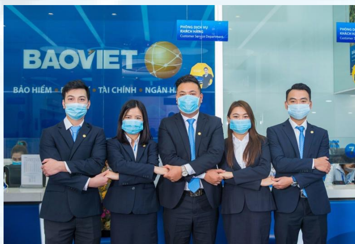
Tổng doanh thu của Bảo Việt nửa đầu năm 2021 vượt 1 tỷ USD.

Dự kiến, ngày 1/8/2021, Bảo Việt Nhân thọ sẽ chính thức ra mắt sản phẩm “An