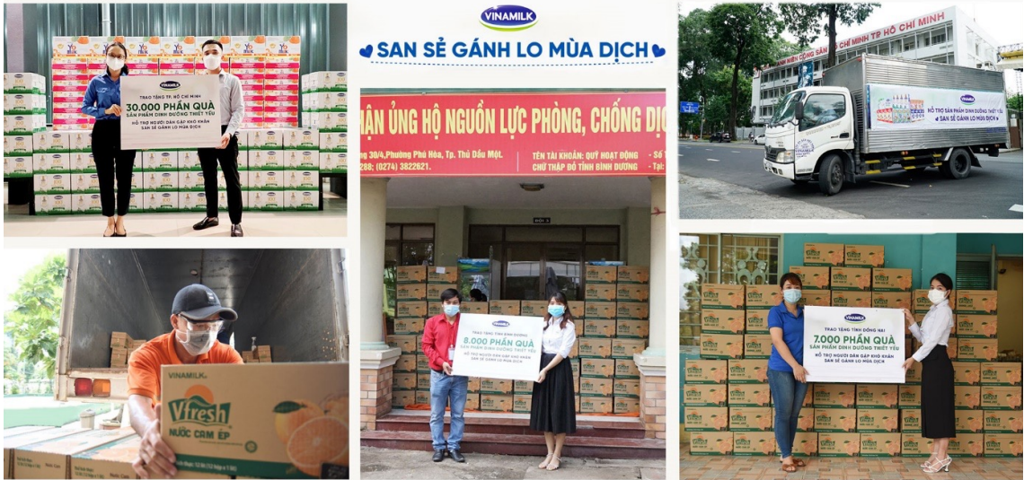
45.000 phần quà là những sản phẩm dinh dưỡng thiết yếu được Vinamilk trao tặng cho người dân, người lao động có hoàn cảnh khó khăn.

các quận huyện để chuyển nhanh nhất những phần quà tặng ý nghĩa và thiết thực này đến tay những người dân, người lao động, sinh viên, các em thiếu nhi, động viên tinh thần cho mọi người trong giai đoạn này.