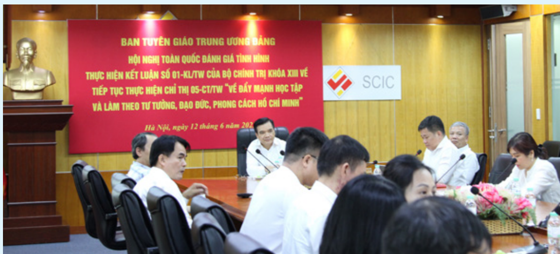
Toàn cảnh buổi họp tại điểm cầu SCIC

chuyên đề vừa góp phần nâng cao chất lượng sinh hoạt chi bộ, năng lực lãnh đạo và sức chiến đấu của tổ chức cơ sở đảng, vừa chấn chỉnh tác phong làm việc của đội ngũ cán bộ, đảng viên, công chức, viên chức, tạo chuyển biến khá rõ nét về kỷ luật, kỷ cương hành chính, từ đó nâng cao niềm tin của Nhân dân với Đảng, với Nhà nước.