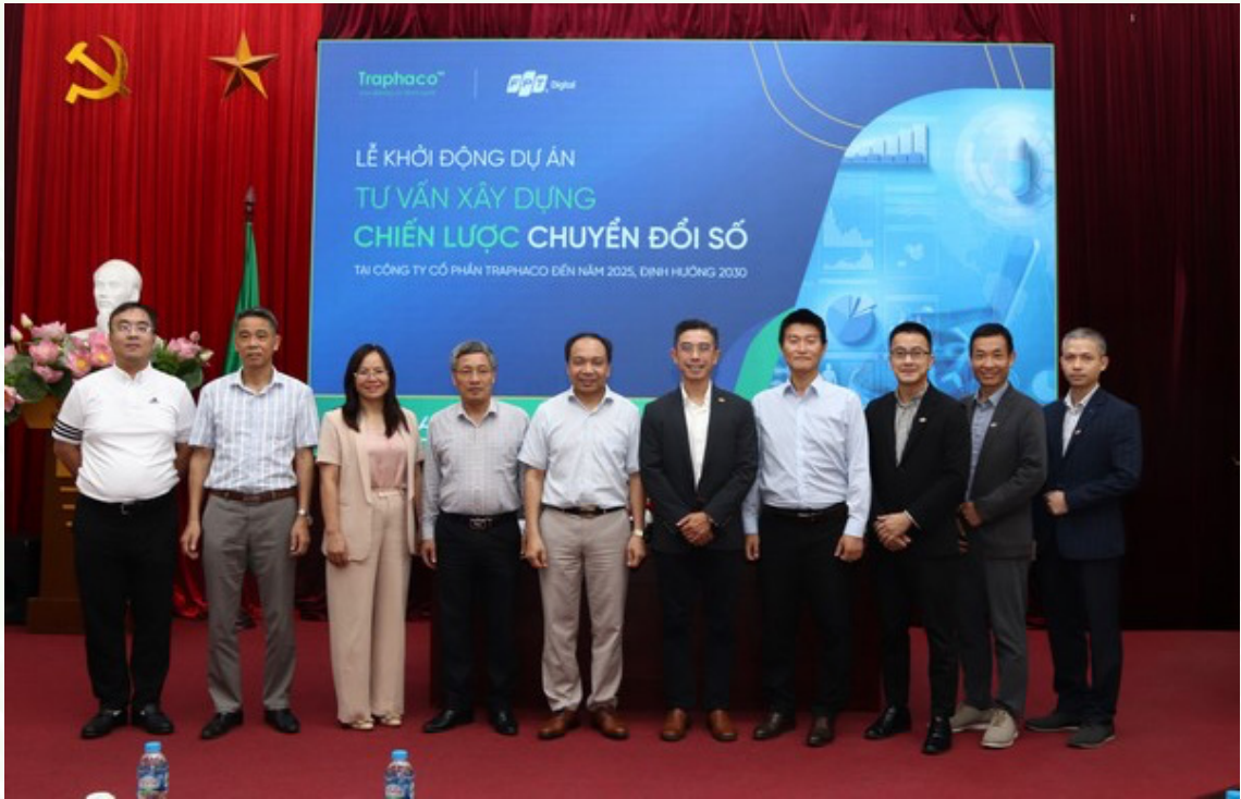
Đại diện Traphaco và FPT Digital chụp ảnh lưu niệm

cơ hội hợp tác hơn nữa trong hệ sinh thái FPT như hợp tác với chuỗi nhà thuốc Long Châu, sử dụng kho dữ liệu khách hàng end user khổng lồ của FPT để đưa sản phẩm Traphaco ngày càng gần hơn với khách hàng và người tiêu dùng.