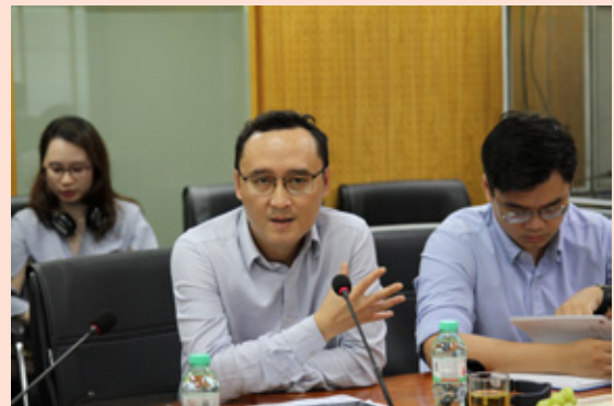
Đại diện Cục Tài chính Doanh nghiệp (Bộ Tài chính) trao đổi tại buổi làm việc

Tại buổi làm việc, Đoàn công tác đã đặt ra một số câu hỏi về các nội dung liên quan đến mô hình hoạt động, chức năng nhiệm vụ của SCIC, cách thức triển khai các hoạt động kinh doanh chính cũng như cơ chế phối hợp giữa SCIC với cơ quan đại diện chủ sở hữu vốn nhà nước và các doanh nghiệp có vốn SCIC thông qua hệ thống Người đại diện. Đoàn công tác cũng bày tỏ sự quan tâm đến một số nội dung gắn liền