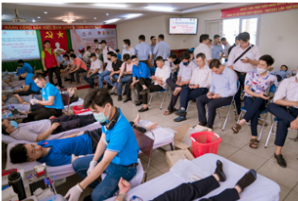
Toàn cảnh khu vực Hiến máu Cụm Biên Hòa - Đồng Nai

Các hoạt động tình nguyện trong hệ thống VNSTEEL luôn nhận được sự quan tâm của các đồng chí Lãnh đạo Tổng công ty, Công đoàn Tổng công ty và ban lãnh đạo các đơn vị. "Hành trình đỏ VNSTEEL" năm 2023, Công đoàn Tổng công ty tiếp tục quan tâm và phối hợp với Đoàn Thanh niên Tổng công ty hỗ trợ các phần quà cho người lao động trong hệ thống tham gia hiến máu, điều này đã góp phần tổ chức thành công Chương trình Hiến máu tình nguyện năm 2023.