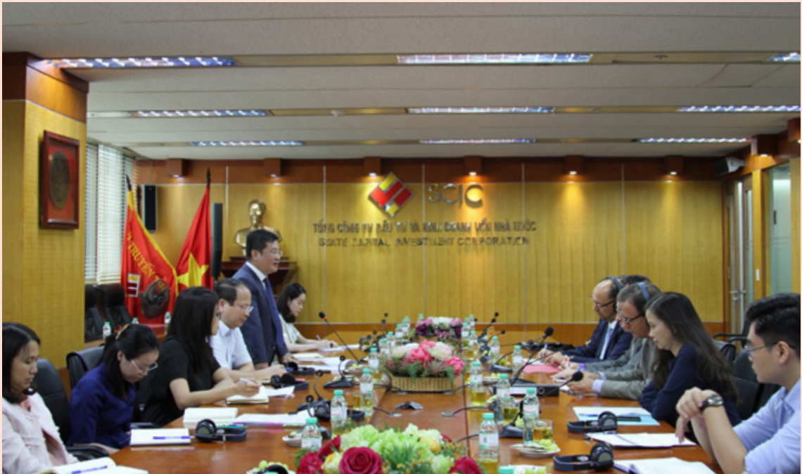
Toàn cảnh buổi làm việc