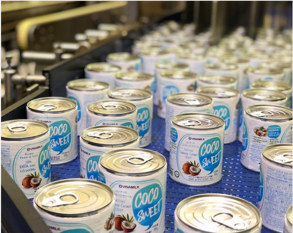
Dây chuyền sản xuất sữa dừa đặc xuất khẩu cho thị trường Nhật Bản.