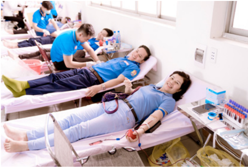
Hiến máu đem lại cho ta niềm vui vì được giúp đỡ ai đó đang cần lượng máu quý giá