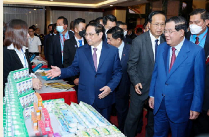
Thủ tướng Phạm Minh Chính thăm gian hàng của Angkormilk tại Diễn đàn Xúc tiến Đầu tư và Thương mại Việt Nam – Campuchia 2022.

Bên cạnh đầu tư nước ngoài, Vinamilk cũng tích cực trong các hoạt động xuất khẩu. Doanh nghiệp đã khai phá mảng xuất khẩu sữa từ những năm 1997 với thị trường chính ở khu vực Trung Đông. Hiện tại, khu vực này đóng góp gần 85% vào tổng doanh thu đến từ hoạt động kinh doanh xuất khẩu của Vinamilk.