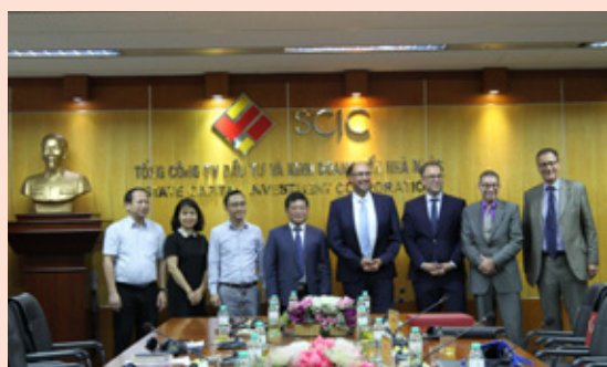
SCIC và đoàn chuyên gia Bộ Tài chính CHLB Đức chụp ảnh lưu niệm

tác song phương và thúc đẩy xúc tiến các tiềm năng hợp tác đầu tư.