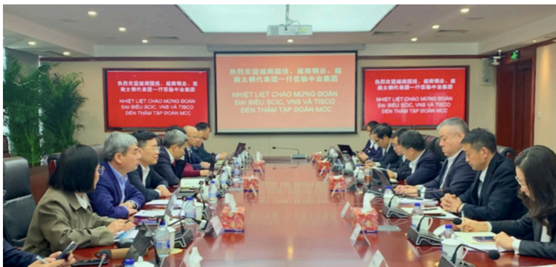
Các bên đàm phán để thống nhất phương án giải quyết dứt điểm các vướng mắc của dự án Tisco 2