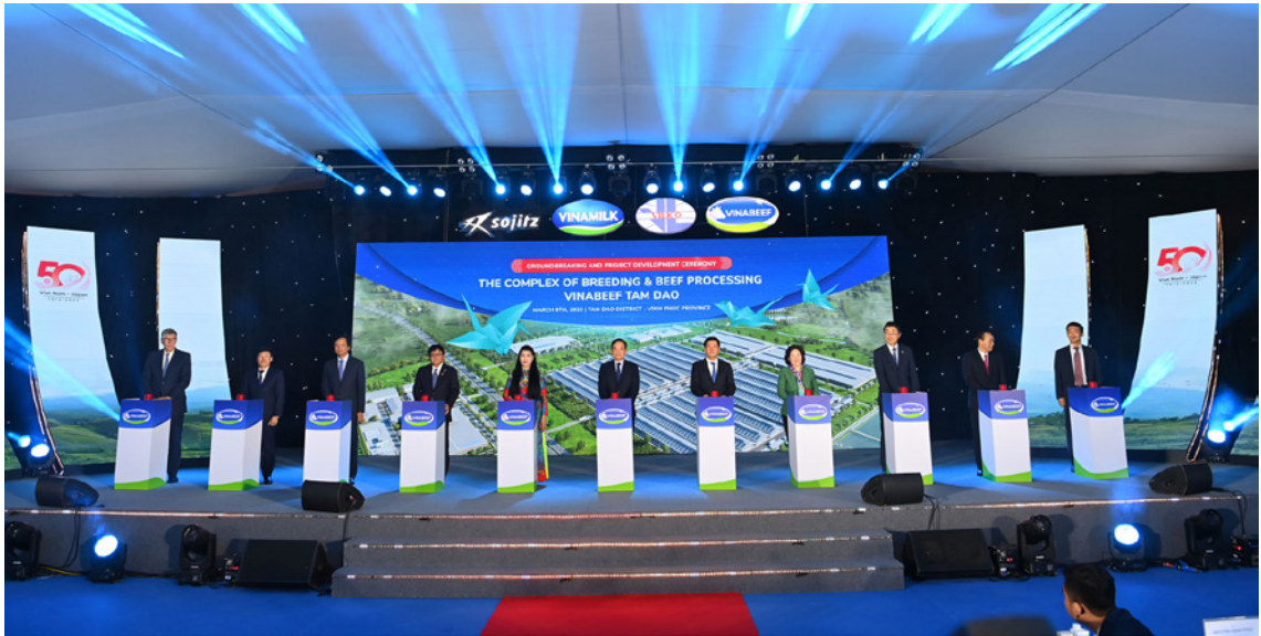
Phó Thủ tướng cùng các đại biểu thực hiện nghi thức khởi công dự án.

Đây là dự án đầu tiên trong kế hoạch đầu tư, hợp tác giữa các tập đoàn hàng đầu Việt Nam và Nhật Bản trong lĩnh vực nông nghiệp công nghệ cao - chăn nuôi và chế biến bò thịt với tổng giá trị thỏa thuận hợp tác lên đến 500 triệu đô la Mỹ đã được kí kết vào cuối năm 2021.