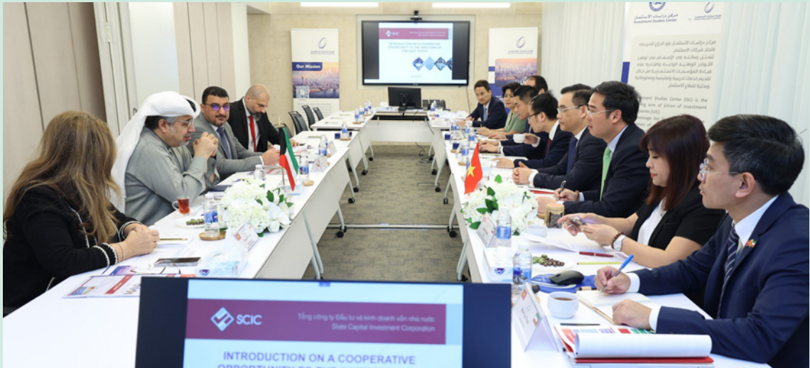
Đoàn công tác của SCIC đã có buổi làm việc với Hiệp hội các Công ty Đầu tư Kuwait (UIC)

triển và môi trường thu hút đầu tư của Việt Nam, UIC quan tâm đến việc giao lưu thương mại và hợp tác với các dự án của Khu vực Kinh tế tự nhân tại Việt Nam.