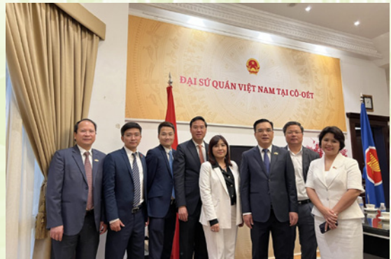
Đoàn công tác SCIC chụp ảnh cùng Đại sứ quán Việt Nam tại Kuwait

Tại Kuwait, Đoàn công tác của SCIC đã gặp gỡ và làm việc với Cơ quan đầu tư Quốc gia Kuwait (KIA). KIA là Quỹ Đầu tư chính phủ thành lập đầu tiên trên thế giới vào năm 1953. KIA chịu trách nhiệm quản lý và điều hành Quỹ dự trữ