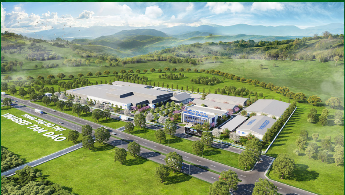
Tổ hợp bao gồm trang trại chăn nuôi và nhà máy chế biến hiện đại

NGÀY 8/3/2023, TAM ĐẢO, VĨNH PHÚC - TỔ HỢP CHĂN NUÔI & CHẾ BIẾN THỊT BÒ VINABEEF TAM ĐẢO, DỰ ÁN CÓ TỔNG QUY MÔ ĐẦU TƯ 3.000 TỶ ĐỒNG DO VILICO (CÔNG TY THÀNH VIÊN CỦA VINAMILK) HỢP TÁC CÙNG TẬP ĐOÀN ĐA NGÀNH SOJITZ CỦA NHẬT BẢN ĐẦU TƯ TẠI VIỆT NAM ĐÃ CHÍNH THỨC ĐƯỢC KHỞI CÔNG TẠI HUYỆN TAM ĐẢO, TỈNH VĨNH PHÚC. BUỔI LỄ CÓ SỰ THAM DỰ CỦA ÔNG TRẦN LƯU QUANG, ỦY VIÊN TRUNG ƯƠNG ĐẢNG, PHÓ THỦ TƯỚNG CHÍNH PHỦ NƯỚC CỘNG HOÀ XÃ HỘI CHỦ NGHĨA VIỆT NAM CÙNG CÁC ĐẠI DIỆN ĐẠI SỨ QUÁN NHẬT TẠI VIỆT NAM, LÃNH ĐẠO CÔNG TY VINAMILK, VILICO, SOJITZ & CÔNG TY TNHH CHĂN NUÔI VIỆT NHẬT (VINABEEF).