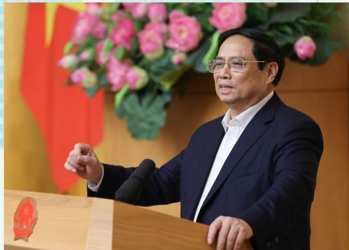
Thủ tướng Phạm Minh Chính phát biểu kết luận hội nghị

Thủ tướng yêu cầu Ủy ban tập trung triển khai kết luận của Bộ Chính trị để hoàn thiện mô