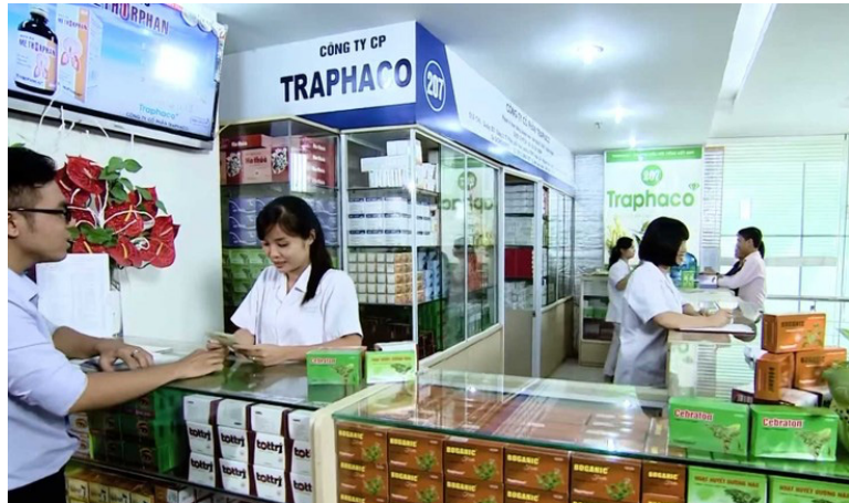
TRA ghi nhận mức doanh thu là 583 tỷ đồng trong quý 4/2022, giảm 1% so với cùng kỳ, trong đó đông dược đóng góp 65% và ngoài đông dược đóng góp 35%.

Tuy nhiên, tỷ suất lợi nhuận của công ty lại thấp hơn kỳ vọng. Tỷ suất lợi nhuận gộp của Traphaco duy trì ở mức 53%, đi ngang so với cùng kỳ. Trong khi doanh thu hầu như không đổi so với quý 4/2021, chi phí bán hàng và chi phí quản lý tăng thêm lần lượt là 10% và 18%. Chi phí bán hàng tăng do tuyển dụng nhiều hơn, tăng