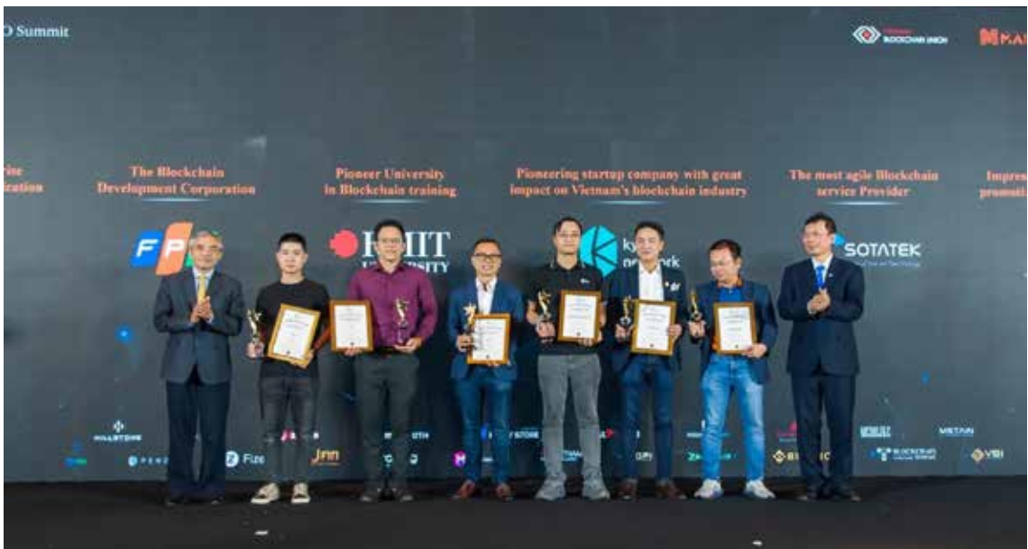
Đại diện Tập đoàn FPT (thứ ba từ trái sang) nhận giải thưởng “Tập đoàn tiên phong phát triển blockchain của năm”.

MỚI ĐÂY, TẠI GIẢI THƯỞNG BLOCKCHAIN VIỆT NAM, TẬP ĐOÀN FPT ĐÃ ĐƯỢC XƯỚNG TÊN TẠI HẠNG MỤC VINH DANH CÁC ĐƠN VỊ UY TÍN CÓ ĐÓNG GÓP CHO SỰ PHÁT TRIỂN CỦA LĨNH VỰC BLOCKCHAIN TẠI VIỆT NAM.