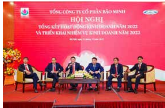
Ban lãnh đạo Tổng Công ty Cổ phần Bảo Minh