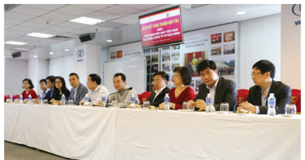
Phía đại diện Tập đoàn Dệt may (Vinatex)