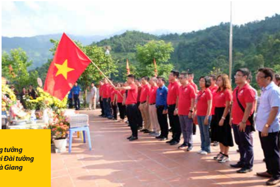
Đoàn công tác dâng hương tưởng nhớ các Anh hùng liệt sỹ tại Đài tưởng niệm 468, Vị Xuyên, tỉnh Hà Giang

Tại tỉnh Hà Giang, đoàn công tác SCIC đã thăm hỏi, tặng quà gia đình các gia đình chính sách, thương binh, cựu chiến binh trong các cuộc chiến tranh bảo vệ tổ quốc.