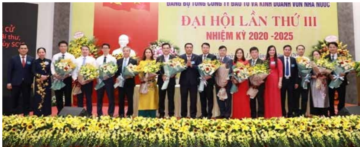
Ban Chấp hành Đảng bộ SCIC nhiệm kỳ 2020 - 2025 ra mắt Đại hội