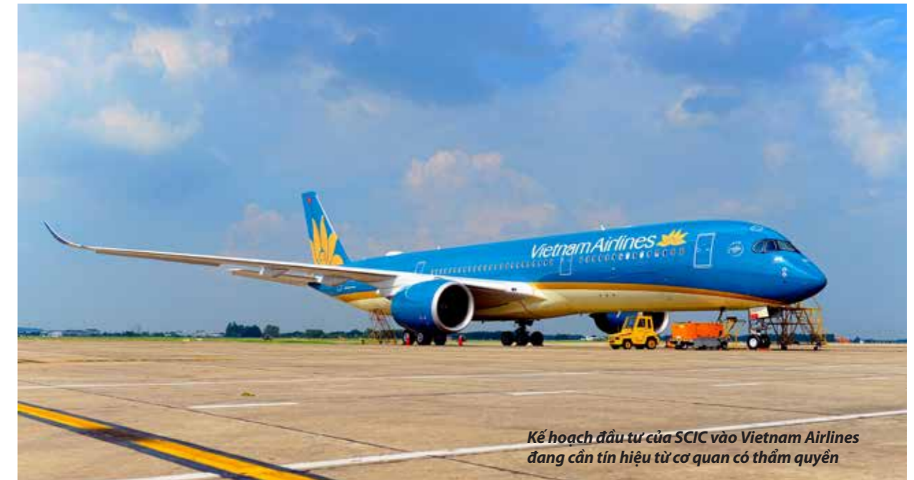
Kế hoạch đầu tư của SCIC vào Vietnam Airlines đang cần tín hiệu từ cơ quan có thẩm quyền