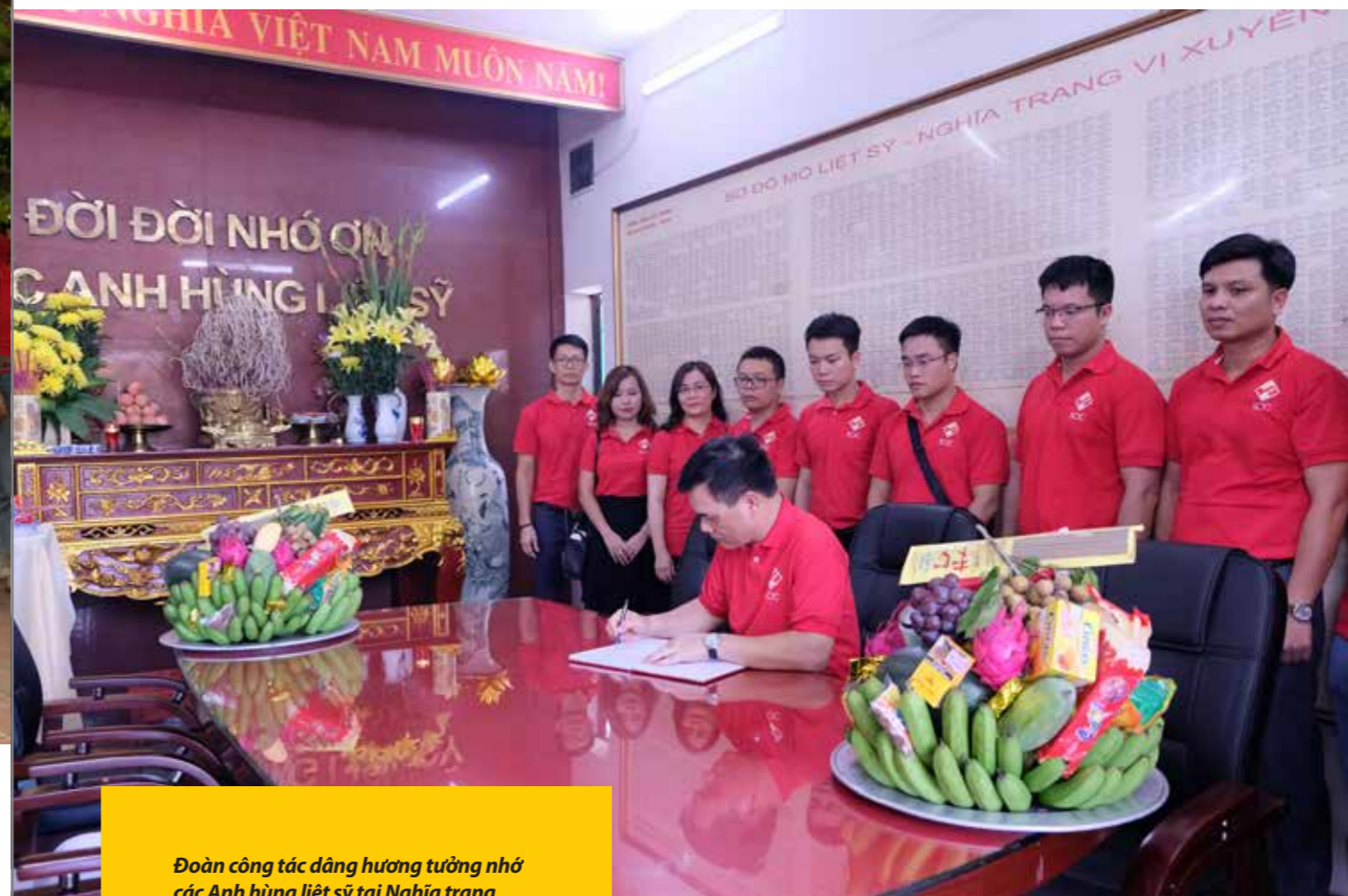
Đoàn công tác dâng hương tưởng nhớ các Anh hùng liệt sỹ tại Nghĩa trang Liệt sỹ quốc gia Vị Xuyên, tỉnh Hà Giang

tưởng niệm 468- xã Thanh Thủy, huyện Vị Xuyên, tỉnh Hà Giang, nơi cách đây 36 năm trước đã diễn ra những trận đánh khốc liệt trong cuộc chiến đấu bảo vệ biên giới phía Bắc của Tổ quốc. Trong không khí linh thiêng tại Đài tưởng niệm 468, đoàn công tác đã thành kính thắp hương và gióng tiếng chuông tưởng niệm anh linh những liệt sỹ đã hy sinh vì nước trong cuộc chiến đấu năm xưa.