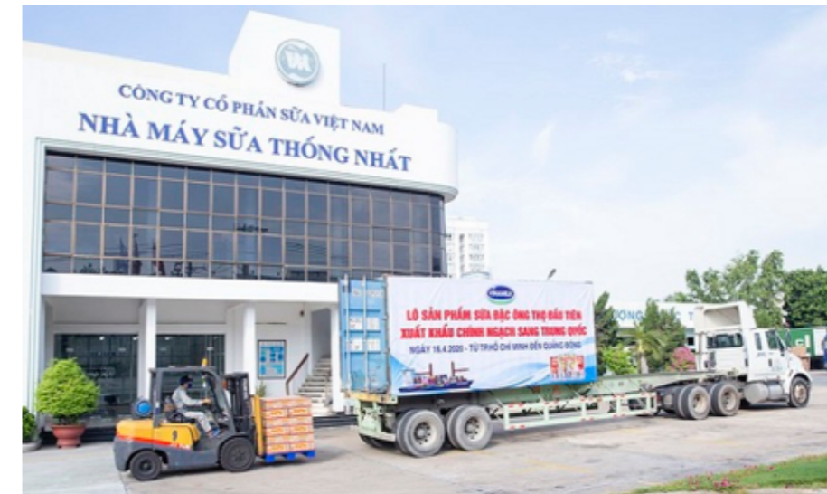
Lô sữa đặc Ông Thọ được Vinamilk xuất khẩu đi Trung Quốc trong tháng 4-2020.

Thị trường các nước trong EAEU được đánh giá là có nhu cầu lớn về các mặt hàng thế mạnh của Việt Nam, trong đó có nông sản. Hơn nữa, Hiệp định Thương mại tự do giữa Việt Nam và EAEU có hiệu lực từ cuối năm 2016 đã mở ra những cơ hội giao thương lớn giữa các nước. Theo số liệu thống kê, năm 2018, kim ngạch xuất nhập khẩu Việt Nam và EAEU đạt 4,9 tỷ USD. Trong 9 tháng đầu năm 2019, con số này đạt 3,7 tỷ USD, trong đó Liên bang Nga chiếm tỷ trọng lớn nhất với hơn 90%.