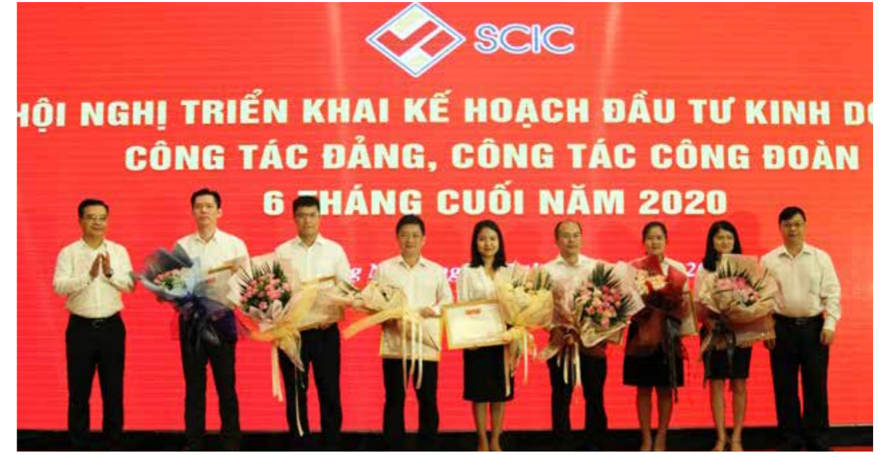
SCIC tổ chức Hội nghị sơ kết hoạt động, công tác Đảng 6 tháng đầu năm, triển khai kế hoạch 6 tháng cuối năm 2020