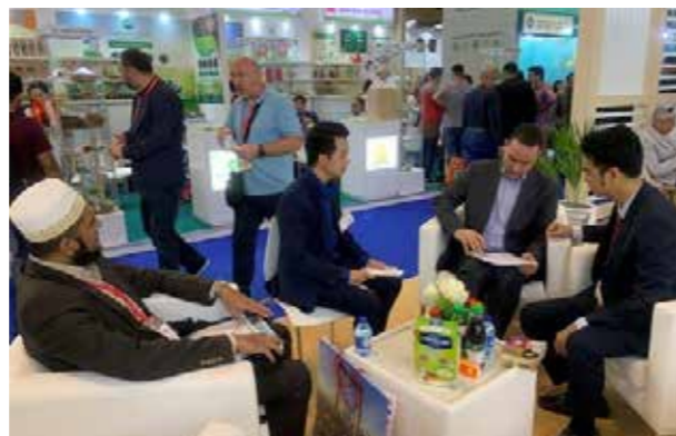
Vinamilk tham gia Hội chợ Gulfood Dubai và ký kết thành công hợp đồng xuất khẩu sữa trị giá 20 triệu USD tại đây.

Từ năm 2015, Vinamilk đã tiến hành các hoạt động giới thiệu sản phẩm, xúc tiến thương mại tại Nga.