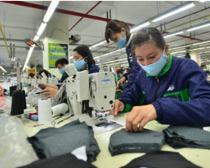
Doanh nghiệp chuyển hướng sản xuất, tìm kiếm thị trường mới để tạo việc làm cho người lao động

Nhu cầu tiêu dùng giảm mạnh, hàng hóa không xuất khẩu được là những khó khăn mà ngành chế biến gỗ và sản xuất sản phẩm từ gỗ. Nhiều DN phải cắt giảm quy mô sản xuất, hoạt động cầm chừng. Hiện có hàng trăm ngàn lao động của các DN gỗ đang thất nghiệp.