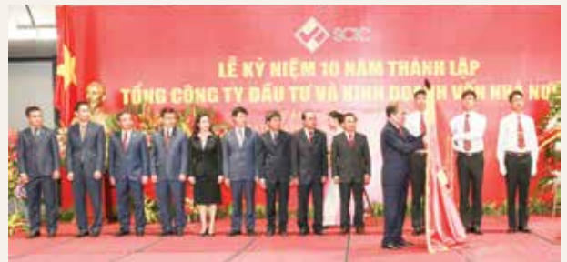
Ảnh: SCIC vinh dự đón nhận Huân chương Lao động hạng Nhất trong lễ kỷ niệm 10 năm ngày thành lập

Đảng bộ SCIC đã thực hiện tốt chức năng, nhiệm vụ của tổ chức Đảng trong DNNN, đảm bảo vai trò lãnh đạo, chỉ đạo trong thực hiện nhiệm vụ chính trị, công tác xây dựng Đảng, công tác cán bộ và lãnh đạo các đoàn thể chính trị - xã hội theo tinh thần Nghị quyết Trung ương. Đảng bộ SCIC luôn được công nhận là Đảng bộ trong sạch vững mạnh và nhiều năm vững mạnh tiêu biểu.