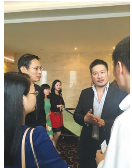
Trao đổi bên lề hội thảo về quản trị dành cho người đại diện vốn nhà nước do SCIC tổ chức

Các chuyên gia quốc tế tin rằng, những nguyên tắc này đóng vai trò là nền tảng giúp SCIC quản lý tốt hơn các công ty chưa đại chúng sẽ được SCIC thoái vốn trong tương lai gần, hoặc các công ty mà SCIC dự định nắm giữ trong dài hạn. Nhiều nội dung trong bộ quy tắc như quyền của cổ đông và đối xử bình đẳng với cổ đông, vai trò của các bên có quyền lợi liên quan trong quản trị doanh nghiệp... được mô tả