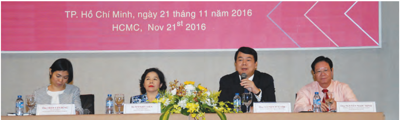
Đại diện SCIC và Vinamilk giải đáp các câu hỏi của nhà đầu tư