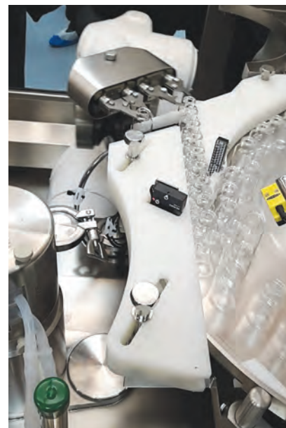
Dây chuyền tự động hóa bằng cánh tay robot để đóng chai thành phẩm.

Hai bên đã tiến hành ký Biên bản hợp tác - MOU để thống nhất nguyên tắc các nội dung triển khai hợp tác. Theo đó, các bên cùng bàn bạc nội dung của Thỏa thuận về quyền sở hữu và cung ứng sản phẩm và Thỏa thuận hỗ trợ thiết kế xây dựng nhà máy.