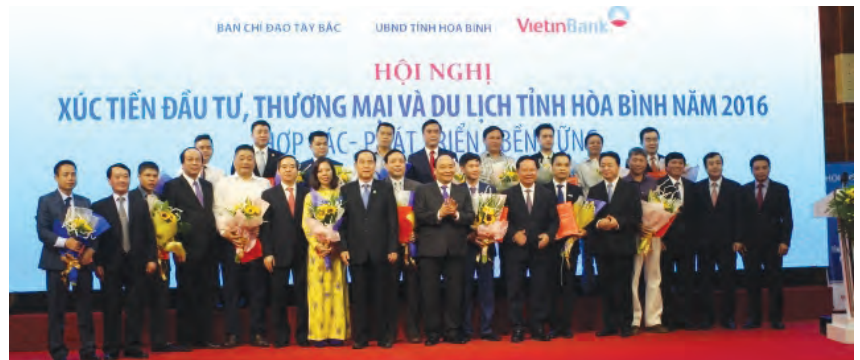
Thủ tướng Chính phủ Nguyễn Xuân Phúc dự hội nghị xúc tiến đầu tư thương mại và du lịch tỉnh Hòa Bình.

Phát biểu tại hội nghị, Thủ tướng Chính phủ Nguyễn Xuân Phúc nhấn mạnh, Hòa Bình có lợi thế so sánh với các địa phương khác, là tỉnh cửa ngõ