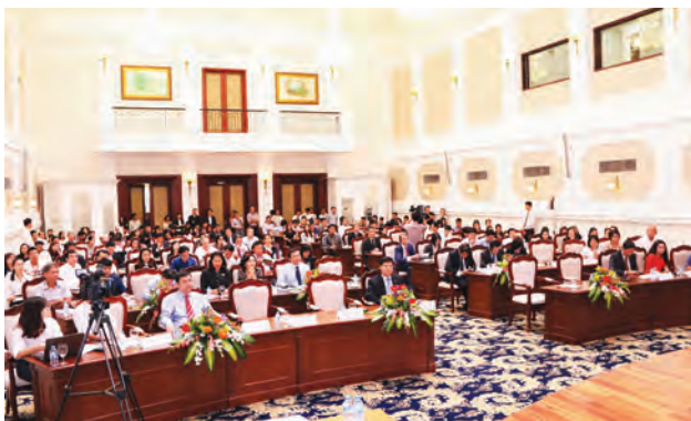
Toàn cảnh buổi làm việc