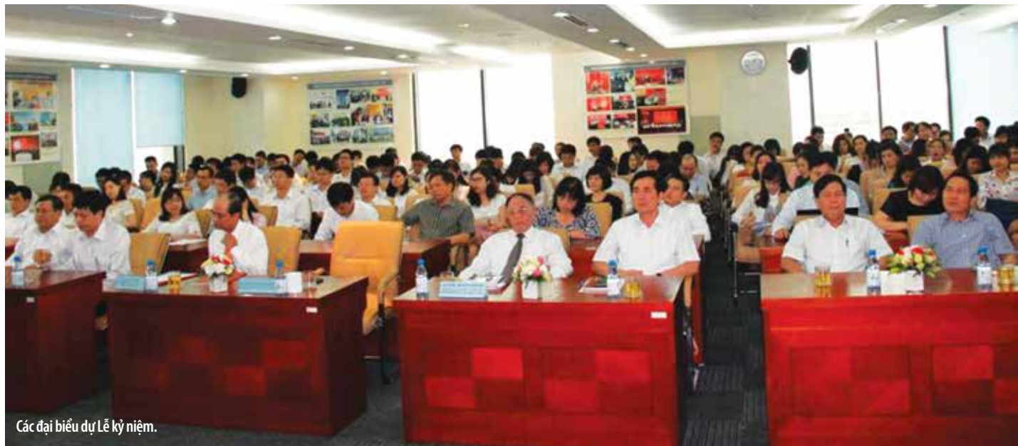
Các đại biểu dự Lễ kỷ niệm.