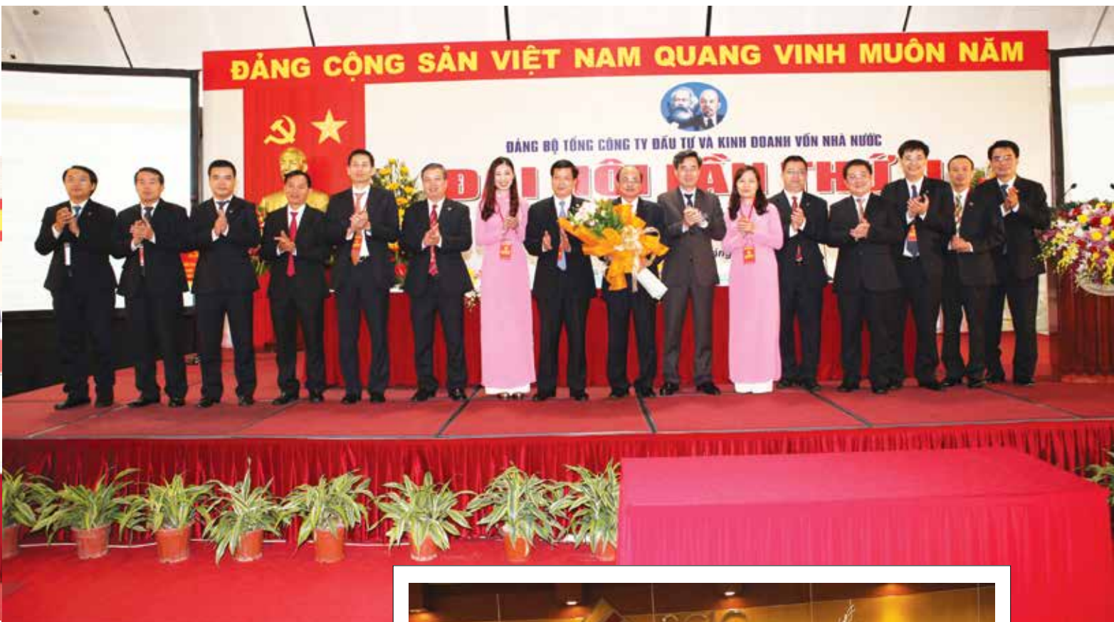
Ban Chấp hành Đảng bộ Tổng công ty Đầu tư và Kinh doanh vốn nhà nước, nhiệm kỳ 2015 - 2020.

cờ thi đua xuất sắc cho Đảng bộ SCIC, nhiệm kỳ 2010 - 2015.