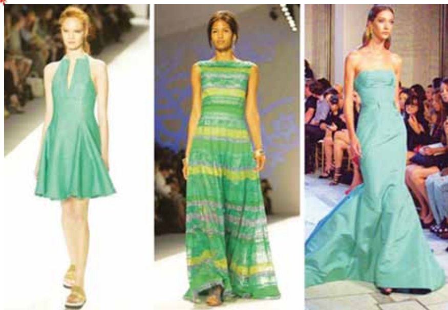
Xanh ngọc đang thống lĩnh bảng màu khi không ngừng bứt phá từ năm ngoái