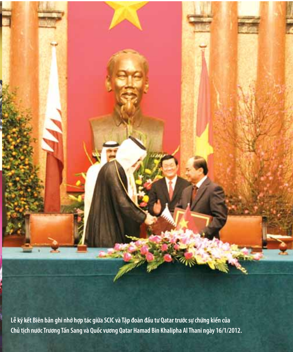
Lễ ký kết Biên bản ghi nhớ hợp tác giữa SCIC và Tập đoàn đầu tư Qatar trước sự chứng kiến của Chủ tịch nước Trương Tấn Sang và Quốc vương Qatar Hamad Bin Khalifa Al Thani ngày 16/1/2012.