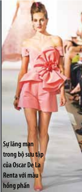
Sự lãng mạn trong bộ sưu tập của Oscar De La Renta với màu hồng phấn