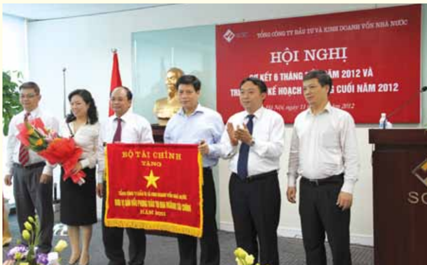
SCIC được tặng Cờ thi đua của Bộ Tài chính cho đơn vị dẫn đầu phong trào thi đua ngành Tài chính năm 2011.