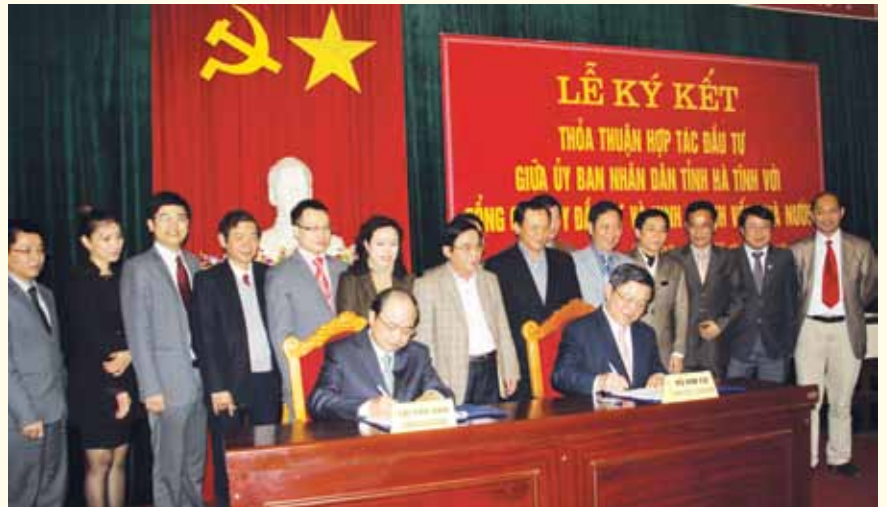
Lễ ký kết thoả thuận hợp tác đầu tư giữa SCIC và tỉnh Hà Tĩnh với, ngày 8/2/2012.