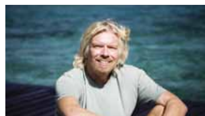
Sở hữu khu nghỉ riêng hoặc đảo tư

Một niềm tự hào khác của lớp người giàu có trong xã hội, đó là danh tính của họ có thể được dùng để đặt tên cho các tòa nhà, sân vận động, bệnh viện. Đó có thể là những công trình mà họ đầu tư phần lớn hoặc bỏ tiền mua về và đổi tên.