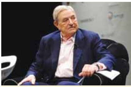
Mọi người sẽ lắng nghe lời tỷ phú nói

Họ có thể đổ tiền tài trợ cho những chiến dịch tranh cử chức vụ chính trị của những người mà họ ưa thích hoặc thậm chí là tự ứng cử mình.