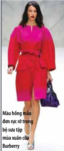
Màu hồng mẫu đơn rực rỡ trong bộ sưu tập mùa xuân của Burberry