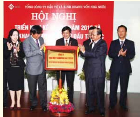
Lễ khai lựa bảng tên khai trương Công ty Đầu tư SCIC ngày 18/1/2013.