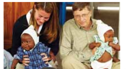
Thay đổi cuộc sống hàng triệu người

Tỷ phú không cần phải chia sẻ nơi nghỉ với những người khác. Họ có thể hưởng thụ bầu không khí trong lành của đồng quê hoặc mát rượi của biển theo cách hoàn toàn tự do và riêng tư. Những tỷ phú như Richard Branson còn sở hữu cả một hòn đảo, để có thể rong ruổi một mình mà không lo bất cứ ai làm phiền.