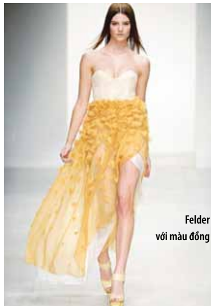
Felder với màu đồng

của pastel, thêm một chút sắc màu nóng nần để cho ra một bảng màu tuyệt vời, bảng màu tươi sáng như ánh nắng của mùa xuân 2013.