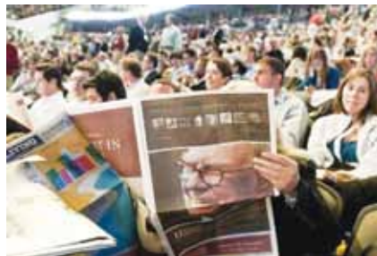
Có sức hấp dẫn đặc biệt người khác

Tỷ phú là người được phép uống rượu thoải mái và không bao giờ phải lo tới việc bị cảnh sát giao thông hỏi thăm. Đơn giản vì họ luôn có người lái xe. Tuy nhiên, “đặc quyền” này không chỉ đúng với tỷ phú, mà còn với doanh nhân, chính trị gia hoặc thậm chí là người bình thường nếu họ đi taxi sau mỗi lần nhậu.