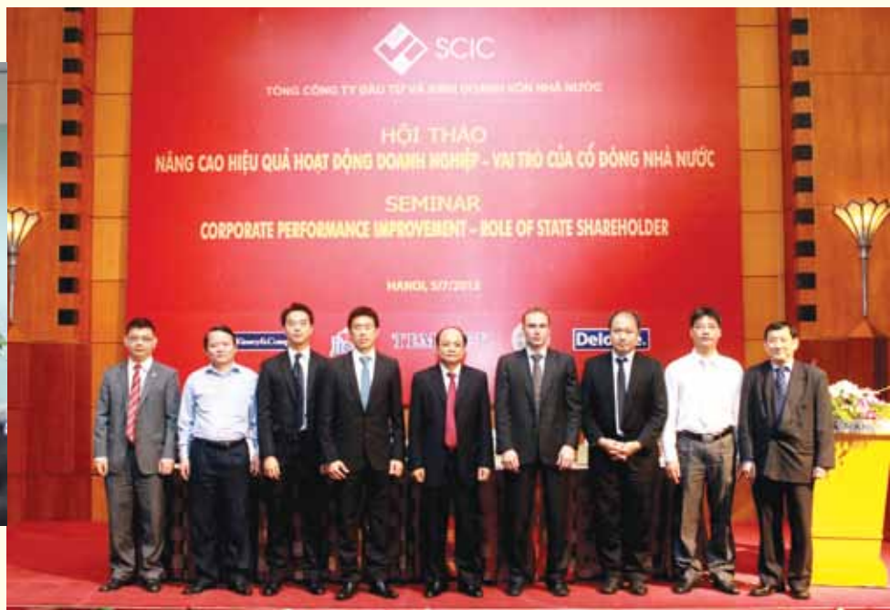
Hội thảo “Nâng cao hiệu quả hoạt động của DN – Vai trò của cổ đông nhà nước” ngày 5/7/2012.