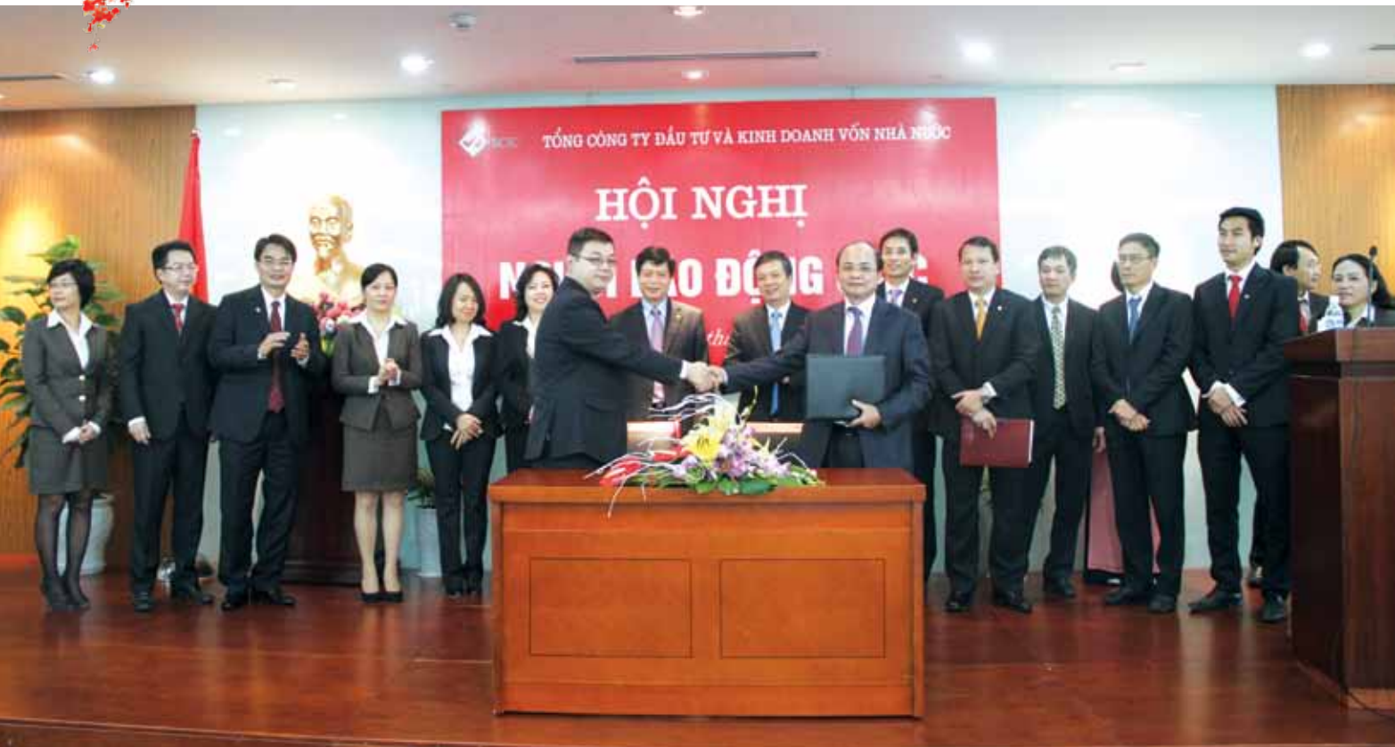
Lễ ký kết giao ước thi đua và Hội nghị Người Lao động năm 2012, ngày 18/1/2013.