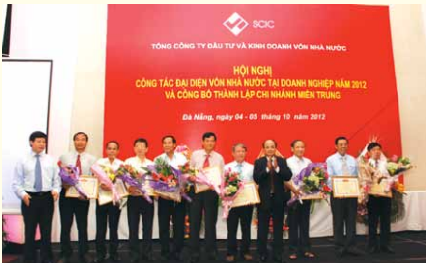
Hội nghị công tác đại diện vốn nhà nước tại DN năm 2012, ngày 4-5/10/2012.