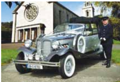
Không lo phạm luật giao thông

Tỷ phú là người được phép uống rượu thoải mái và không bao giờ phải lo tới việc bị cảnh sát giao thông hỏi thăm. Đơn giản vì họ luôn có người lái xe. Tuy nhiên, “đặc quyền” này không chỉ đúng với tỷ phú, mà còn với doanh nhân, chính trị gia hoặc thậm chí là người bình thường nếu họ đi taxi sau mỗi lần nhậu.