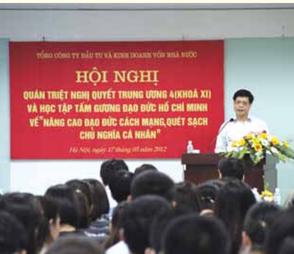
SCIC tổ chức Hội nghị quán triệt Nghị quyết Trung ương 4 (khóa XI) ngày 17/5/2012.