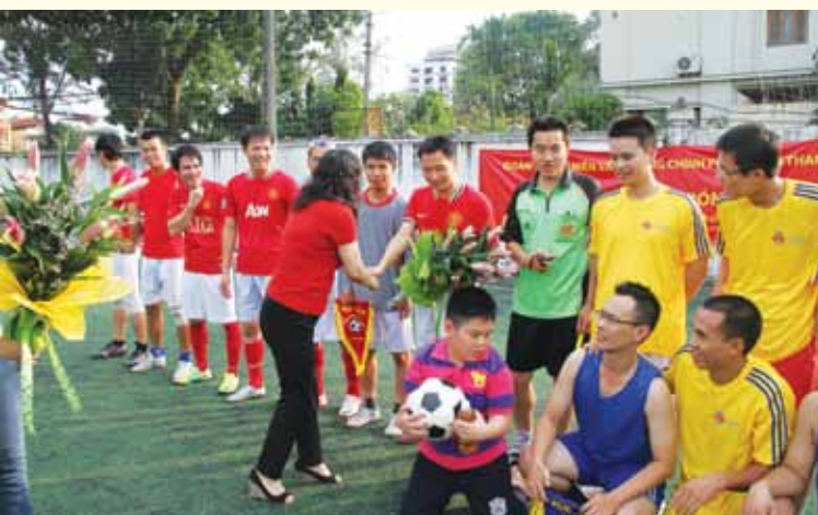
Giao hữu bóng đá giữa Văn phòng Chính phủ và SCIC.