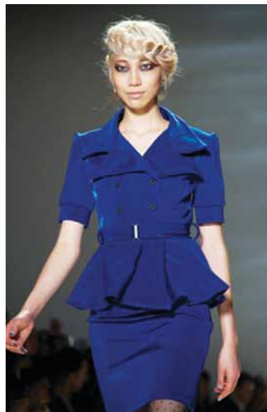
Màu xanh mực đang nổi trội trong mùa Thu - Đông 2012 và Xuân - Hè 2013