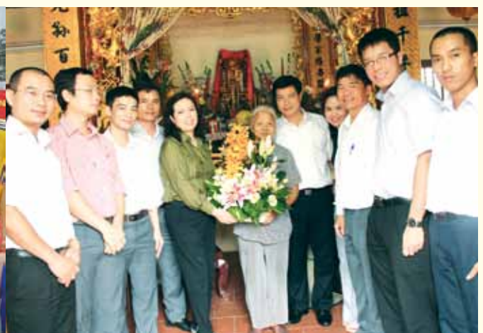
Lãnh đạo SCIC thăm và tặng quà nhân ngày Thương binh Liệt sỹ.