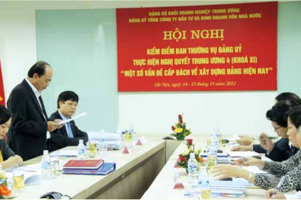
Hội nghị Kiểm điểm Ban thường vụ Đảng ủy thực hiện Nghị quyết Trung ương 4 (khóa XI) ngày 14-15/11/2012.