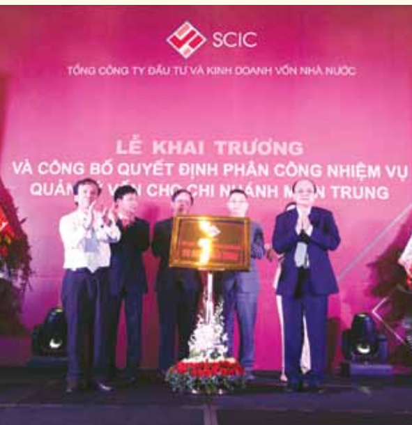
Lễ Khai trương chi nhánh miền Trung ngày 18/12/2012.