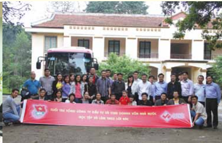
Đoàn Thanh niên SCIC về thăm vùng đất thiêng K9 Đá Chông ngày 7/4/2012