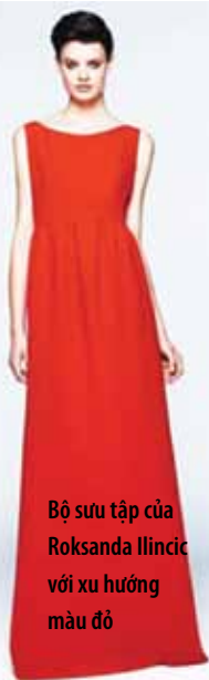
Bộ sưu tập của Roksanda Ilincic với xu hướng màu đỏ