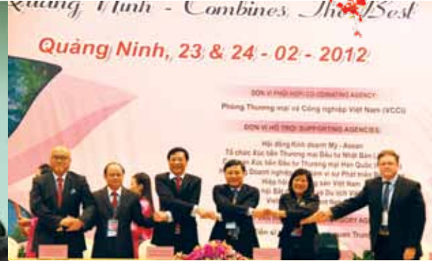
Hội nghị xúc tiến đầu tư Quảng Ninh