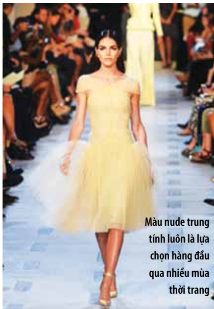
Màu nude trung tính luôn là lựa chọn hàng đầu qua nhiều mùa thời trang