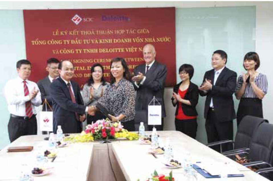
Lễ ký kết biên bản ghi nhớ giữa SCIC và Deloitte.