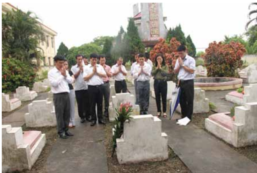
Đoàn đến thắp hương, viếng mộ liệt sỹ tại xã Liêm Tiết, Thanh Liêm, Hà Nam.