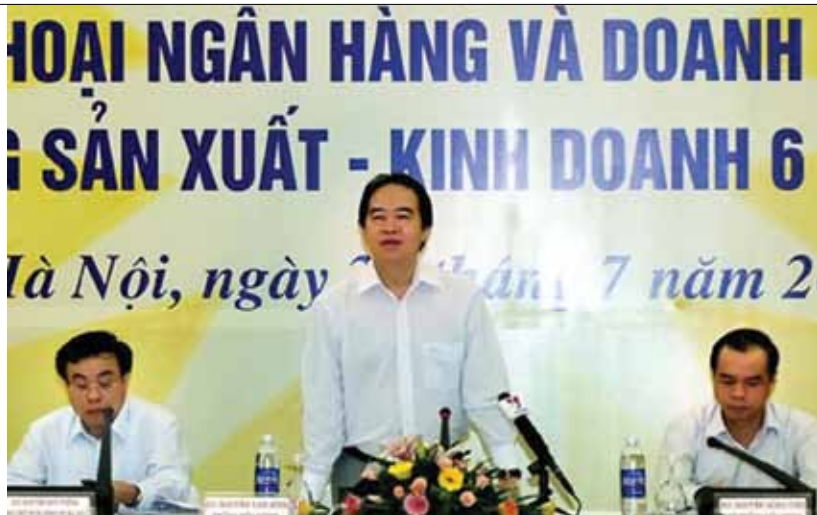
Thống đốc Nguyễn Văn Bình tại buổi đối thoại