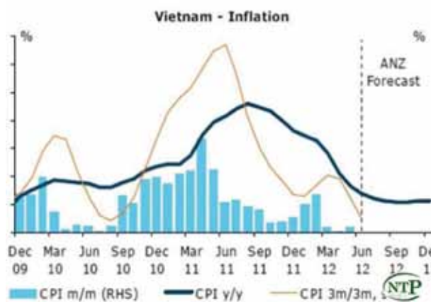
Biểu đồ chỉ số giá tiêu dùng của Việt Nam và ước tính của ANZ.

Báo cáo cho rằng, sau khi đã giảm 500 điểm phần trăm lãi suất trong 6 tháng đầu năm, Ngân hàng Nhà nước có thể sẽ tiếp tục hạ lãi suất trong tương lai gần do những rủi ro suy giảm tăng trưởng GDP còn tồn tại.