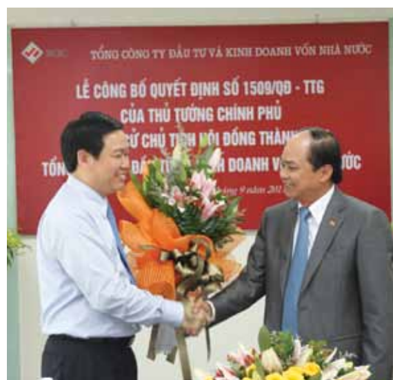
Một số hình ảnh tại Lễ công bố Quyết định của Thủ tướng Chính phủ cử Chủ tịch Hội đồng thành viên SCIC