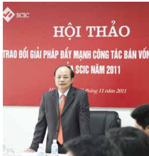
Hội thảo trao đổi giải pháp đẩy mạnh công tác bản vốn nhà nước năm 2011