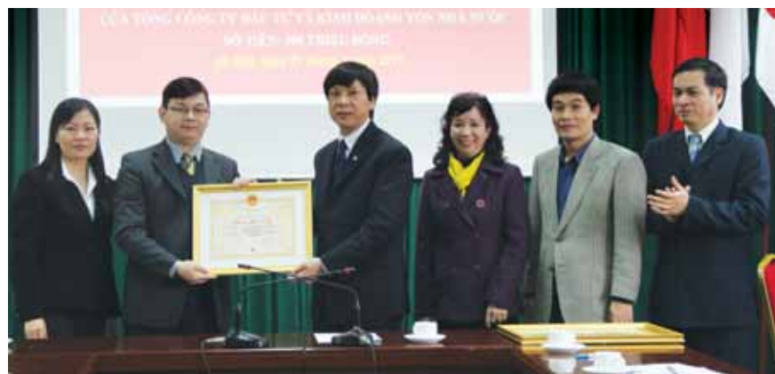
Tổng công ty tích cực tham gia các hoạt động an sinh xã hội, triển khai kế hoạch thực hiện Nghị quyết 30a của Chính phủ về giảm nghèo