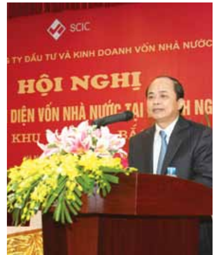
Một số hình ảnh tại Hội nghị Người đại diện năm 2011