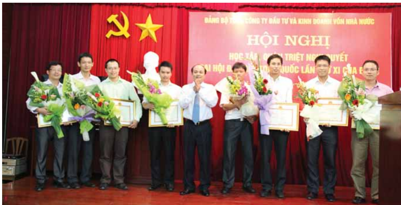
Tổng công ty luôn chú trọng đến công tác đào tạo, nâng cao trình độ cho đội ngũ cán bộ nhân viên và người đại diện vốn nhà nước bằng cách tổ chức các chương trình tập huấn, các buổi hội thảo