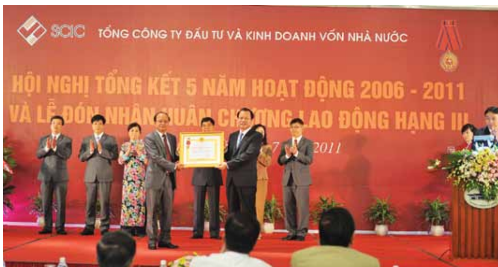
Phó Thủ tướng Vũ Văn Ninh trao Huân chương Lao động hạng Ba cho SCIC