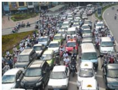
Chính phủ nhìn nhận, việc mua sắm và sử dụng xe ô tô công vượt tiêu chuẩn chế độ, định mức đã cơ bản được khắc phục.

Ở lĩnh vực đầu tư xây dựng cơ bản, báo cáo cho hay tổng số vốn đầu tư các bộ ngành địa phương ngừng khởi công mới, cắt giảm,