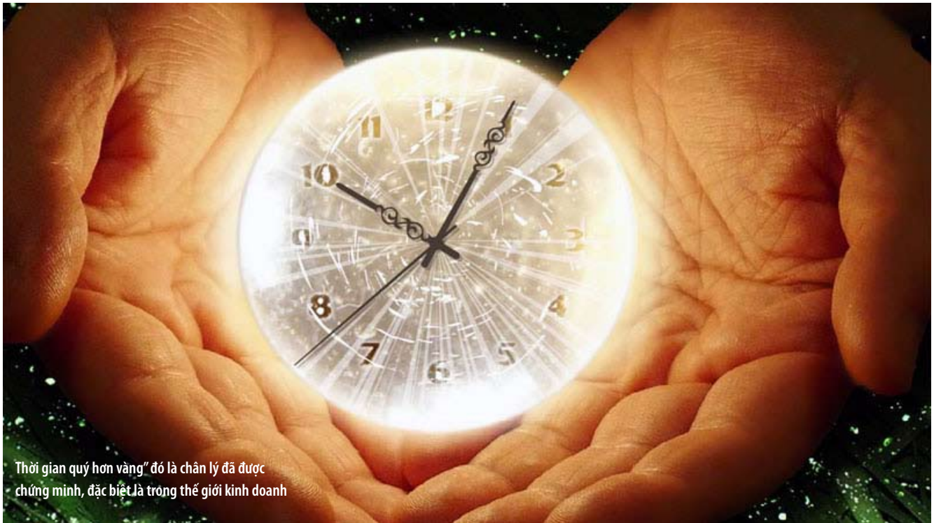
Thời gian quý hơn vàng" đó là chân lý đã được chứng minh, đặc biệt là trong thế giới kinh doanh