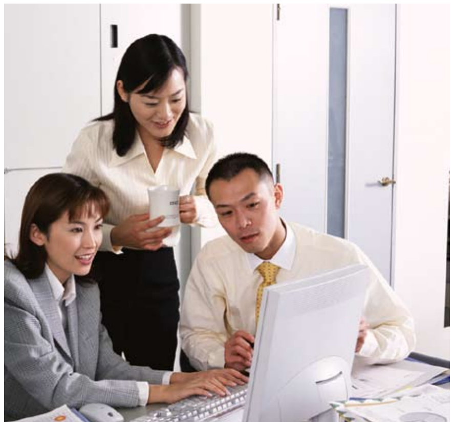
Tâm trạng thoải mái, vui vẻ là liều thuốc bổ tạo sự hứng khởi trong công việc.