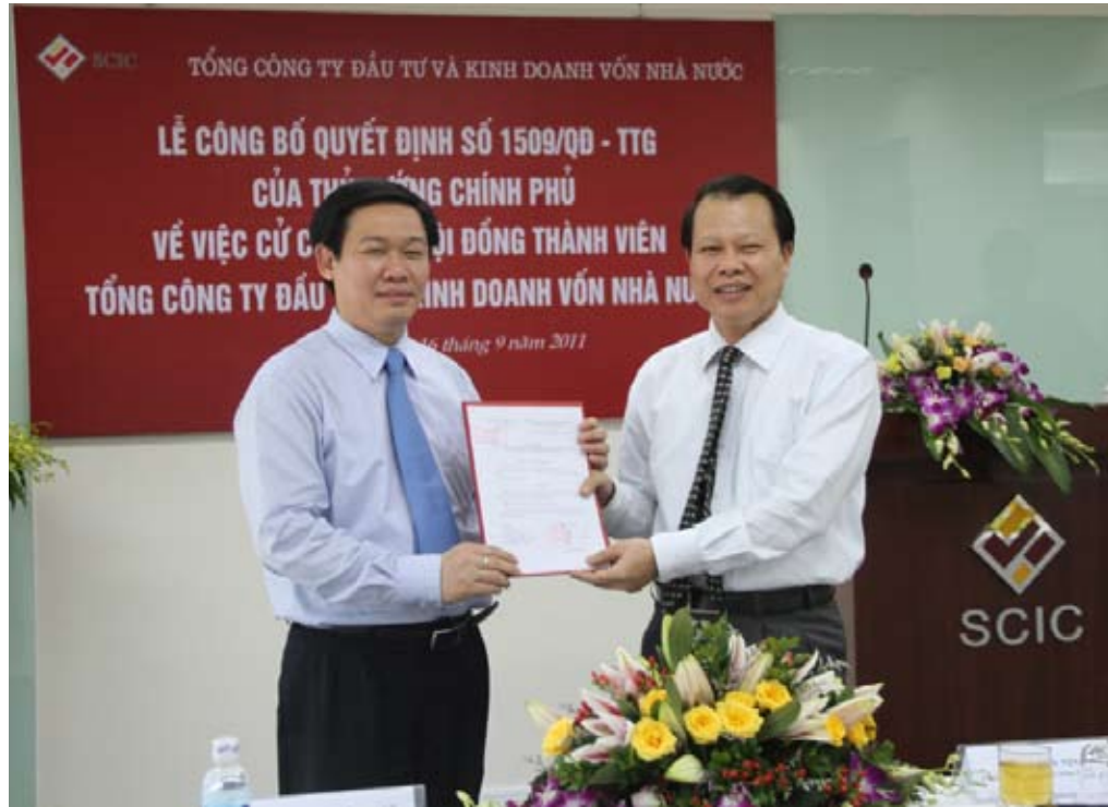
Phó Thủ tướng Vũ Văn Ninh trao quyết định cho Bộ trưởng Tài chính Vương Đình Huệ

Đoàn công tác đã có buổi tiếp xúc và làm việc với đại diện cấp cao của Công ty quản lý quỹ Fullerton (Fullerton Fund Management Company – FFMC), một công ty chuyên về quản lý quỹ và đầu tư tài chính do Temasek sở hữu 100% vốn. (Xem tiếp trang 2)