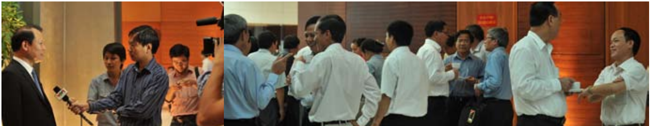
Các đại biểu trao đổi bên lề hội nghị.