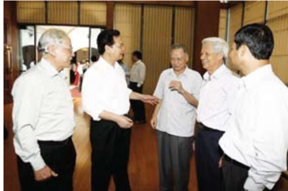
Thủ tướng Nguyễn Tấn Dũng với các đại biểu.

Ngày 20/8, tại Trụ sở Chính phủ, dưới sự chủ trì của Thủ tướng Nguyễn Tấn Dũng, Thường trực Chính phủ và lãnh đạo một số bộ, ngành Trung ương đã làm việc với hơn 30 chuyên gia kinh tế, nhà khoa học trong nước để tham vấn chính sách kinh tế vĩ mô, nhất là chính sách tài chính tiền tệ trong bối cảnh tình hình kinh tế thế giới đang diễn biến hết sức phức tạp.