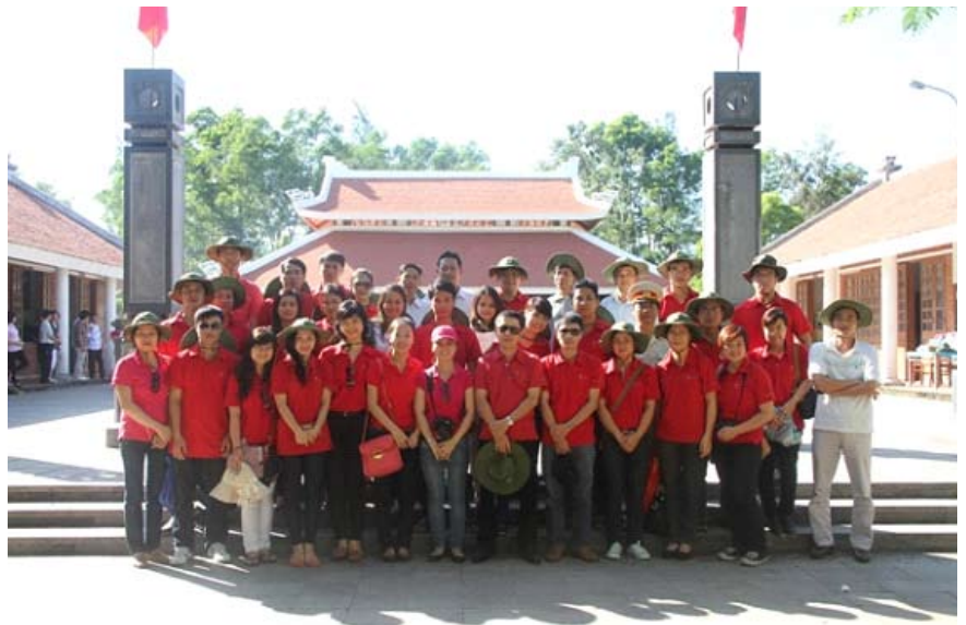
Thăm nghĩa trang Trường Sơn