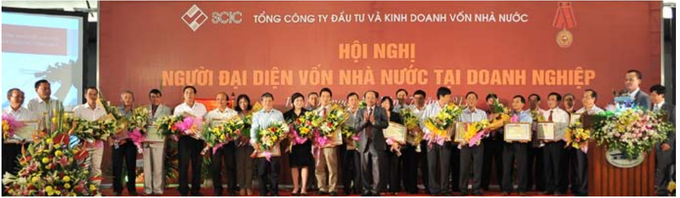
Trao Bằng khen của Bộ trưởng Bộ Tài chính, Giấy khen của Chủ tịch Hội đồng thành viên và Giấy khen của Tổng giám đốc cho những người đại diện có thành tích xuất sắc trong công tác đại diện vốn nhà nước tại doanh nghiệp năm 2010 và trong 5 năm 2006-2011.