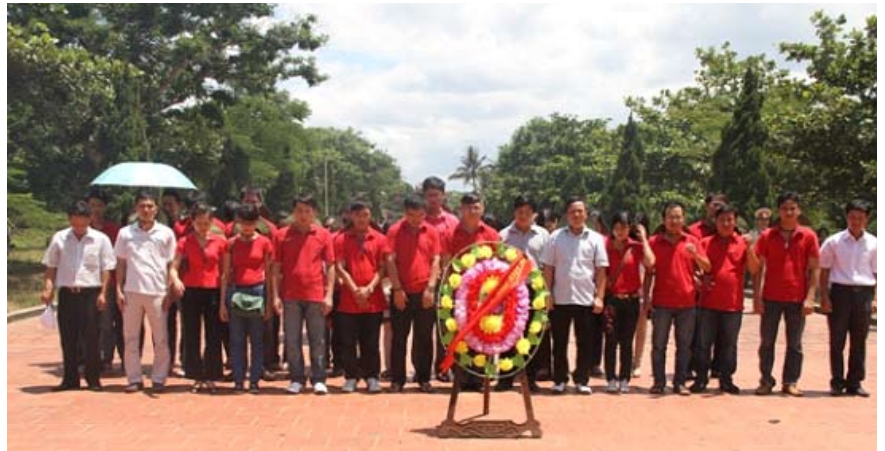
Dâng hương tại đài tưởng niệm các anh hùng liệt sĩ tỉnh Quảng Trị

Trong quá trình tổ chức chuyến đi, SCIC đã nhận được sự giúp đỡ rất lớn của Chi nhánh Ngân hàng phát triển Việt Nam (VDB) Quảng Bình. ■