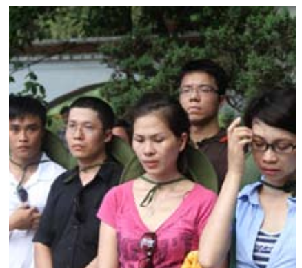
Cảm xúc của các bạn đoàn viên SCIC khi đến thăm Ngã ba Đồng Lộc