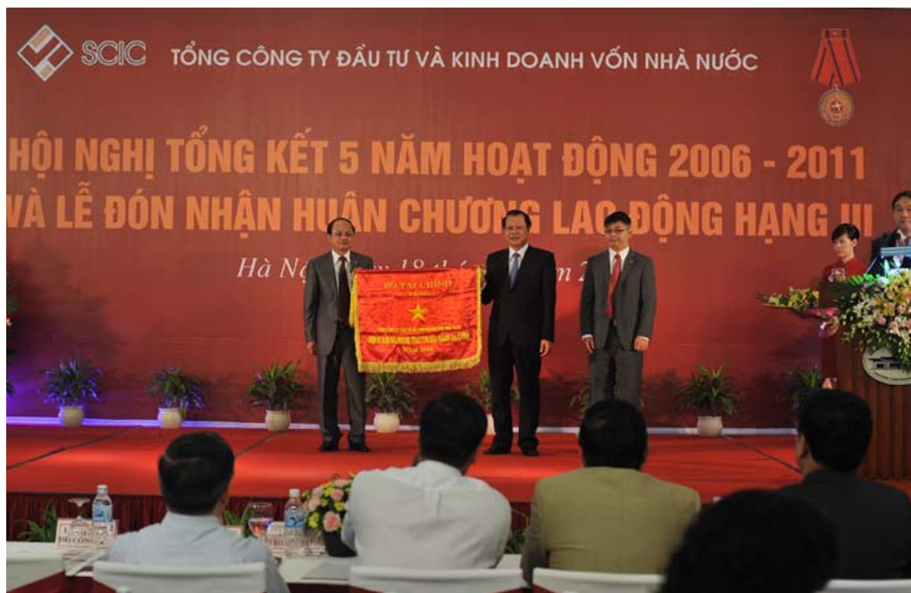
Phó Thủ tướng, nguyên Bộ trưởng Tài chính Vũ Văn Ninh trao tặng cờ thi đua cho SCIC tại Hội nghị Tổng kết 5 năm hoạt động SCIC, ngày 18/7/2011.