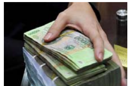
Bắt đầu triển khai việc miễn thuế thu nhập cá nhân

Cũng theo yêu cầu của Bộ Tài chính, từ tháng 8/2011 đến hết tháng 12/2011, bắt đầu miễn thuế thu nhập cá nhân đối với các trường hợp hưởng lương và cá nhân kinh doanh có thu nhập tính thuế nằm trong bậc một của biểu thuế lũy tiến từng phần. Việc miễn thuế này được Quốc hội thông qua trong kỳ họp tháng 7 vừa qua nhằm hỗ trợ cho những người