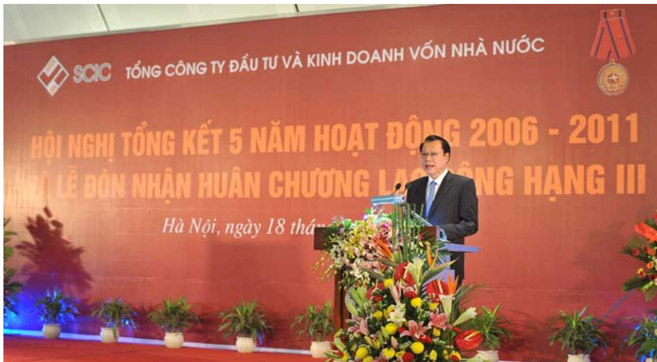
Bộ trưởng Tài chính, Chủ tịch HĐQT SCIC Vũ Văn Ninh phát biểu chỉ đạo